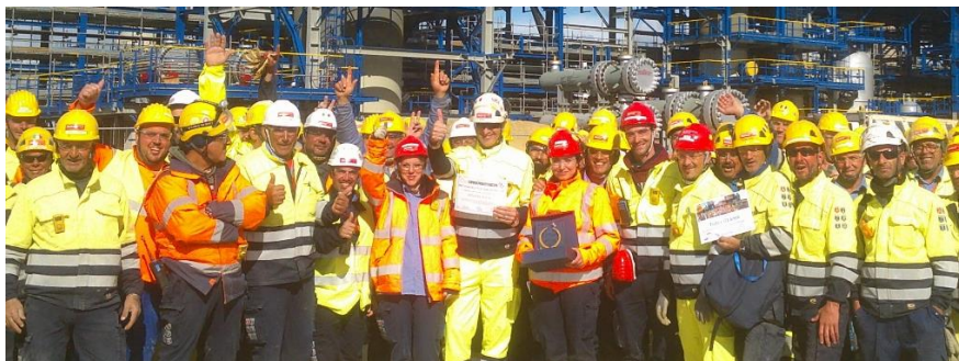
Cantiere Total Donges - Lavori civili nell'ambito del progetto "HORIZON PROJECT-PACKAGE ISBL project" realizzati nella raffineria "Total Raffinage France Donges"