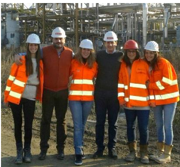
Cantiere Eni Versalis Ferrara - Realizzazione e ristrutturazione di fabbricati, del nuovo Impianto EP (DJM-GP27/Recupero affidabilità produttiva GP26

Solesi S.p.A. si impegna a garantire che i generi siano equamente rappresentati nello svolgimento delle differenti attività aziendali, adoperandosi per evitare ogni forma di discriminazione. È vietata ogni forma di abuso fisico, verbale o digitale sui luoghi di lavoro. La società condanna qualsiasi forma di discriminazione fra i propri lavoratori, inclusa l'esclusione o la preferenza basata su razza, sesso, età, religione, opinione politica, nazionalità o classe sociale. Sia in fase di assunzione e ricerca del personale sia in chiave di promozioni e/o bonus aziendali. In caso in cui si verificano episodi di discriminazione o abuso i dipendenti hanno la piena libertà di denunciarli, attraverso un sistema di segnalazione, che permette anche la denuncia anonima, messo a disposizione di tutti gli stakeholders. Solesi S.p.A. auspica di riuscire ad applicare tali principi lungo tutta la catena di fornitura, in ottica di miglioramento continuo e soddisfazione dei lavoratori e di tutti i collaboratori.